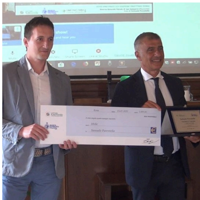
"OBIETTIVO TERRA" 2020: vince Samuele Parentella con la foto del martin pescatore